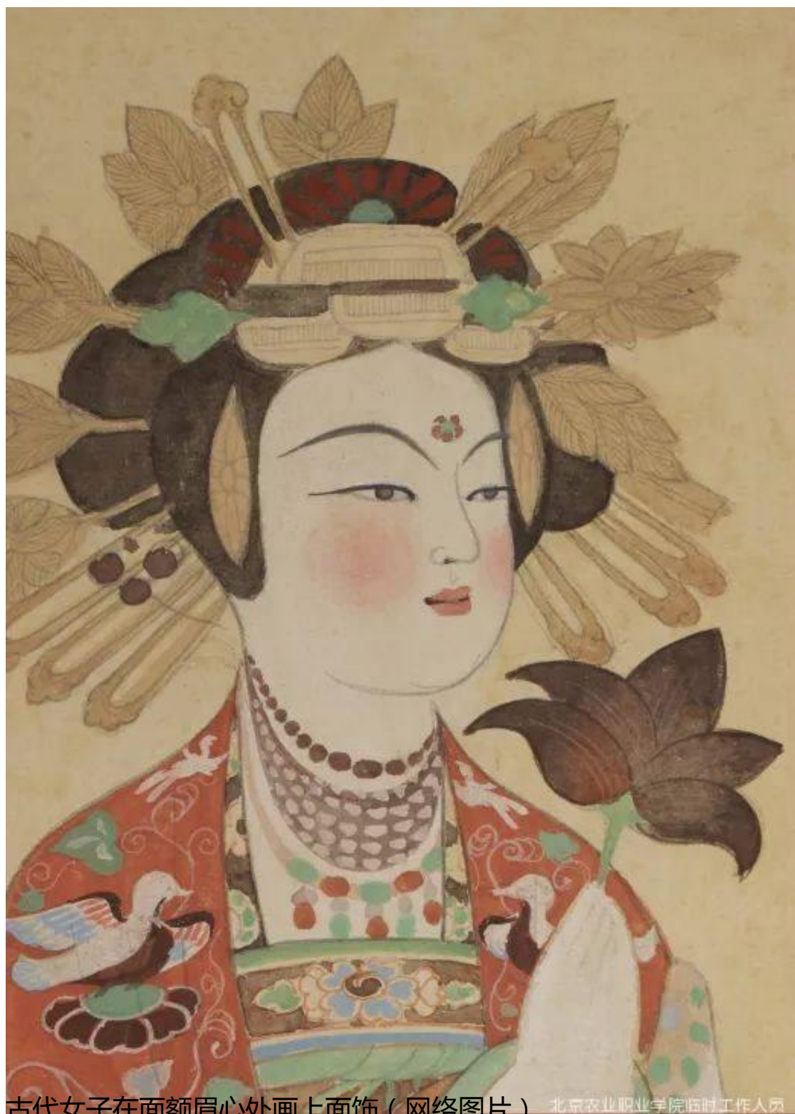
古代女子在面额眉心处画上面饰