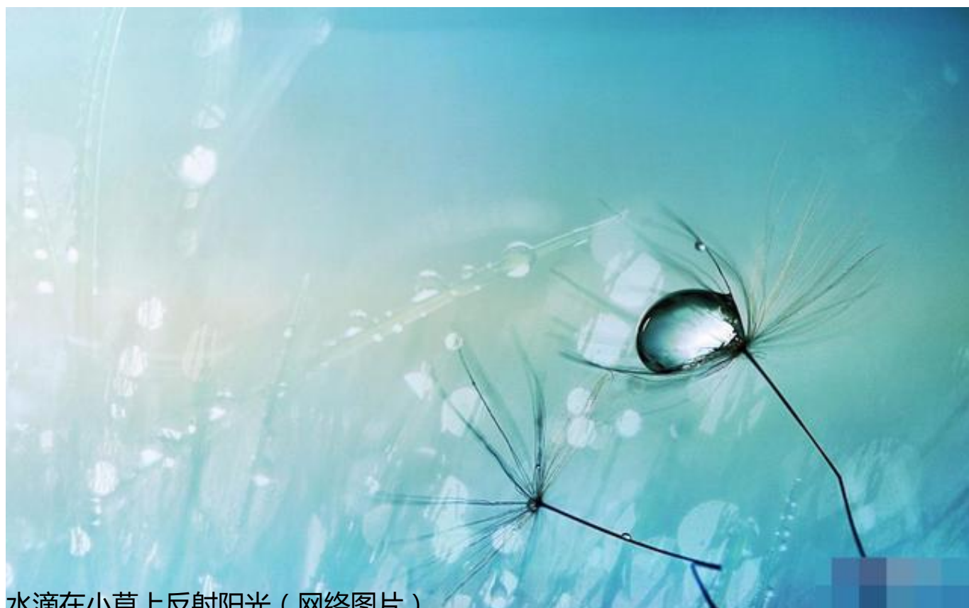
水滴在小草上反射阳光（网络图片）

的由日和勺构成，勺字又可分解为勹[bāo]和“丶 [zhǔ]”，此处的勺字，要看成一个器皿，“丶”字是“勺”字里面的一个水滴。在日光之下，器皿里的水滴就会反射阳光，映衬出白色的阳光。人们看上去，水滴有一部分发白。这里的器皿不一定是人造的陶器，也可以是地面的石板被水滴长期击打形成的小坑。