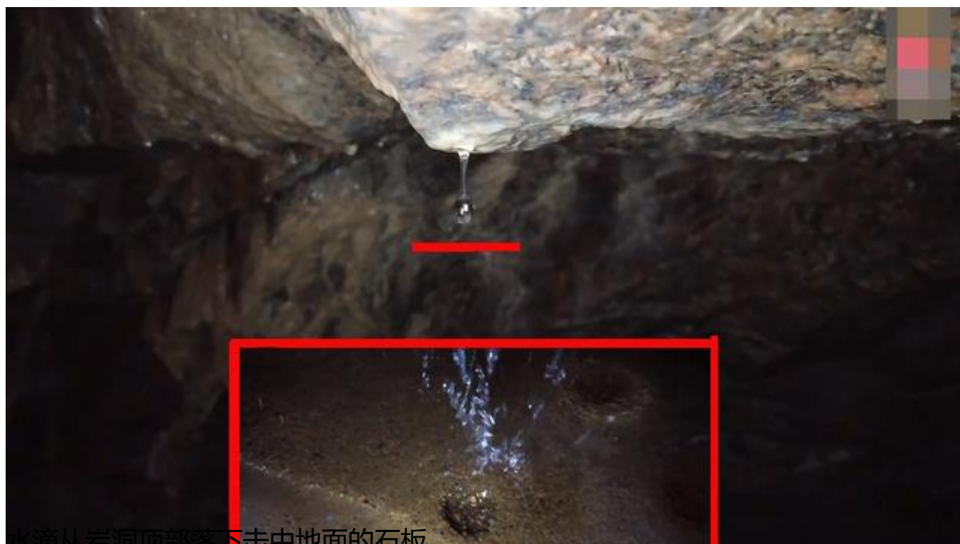
水滴从岩洞顶部落下击中地面的石板

的字，由白和勺构成。看过云鹤阁的《汉字探源：白字本义是自字的省略么？》一文的朋友已经知道，白字本义是阳光照射下的水滴，但勺字并不是表示读音，而是一种形象。