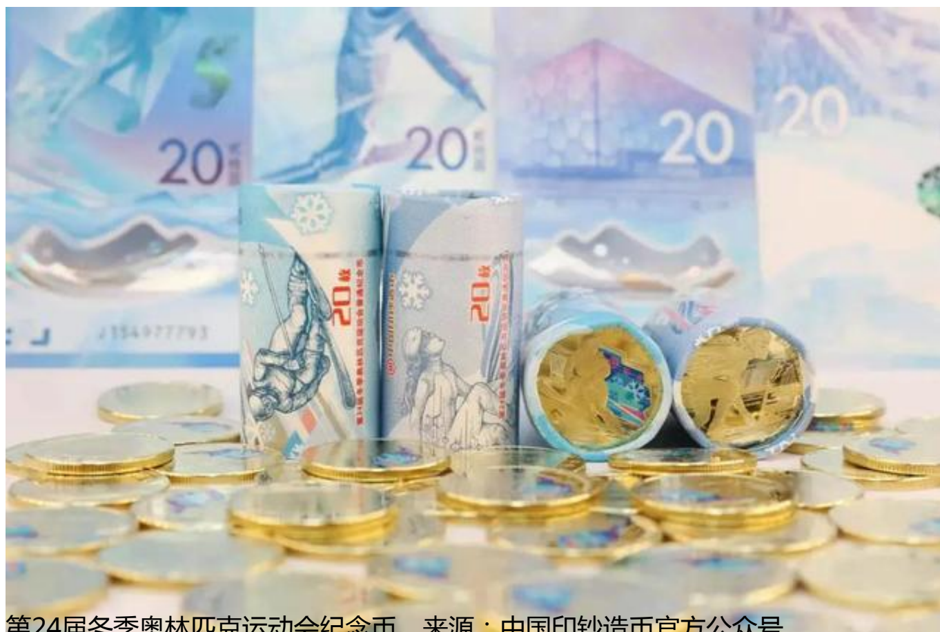
第24届冬季奥林匹克运动会纪念币。