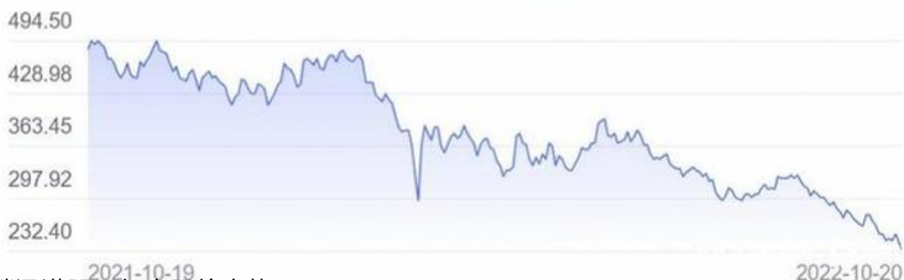
腾讯港股一年来股价走势。