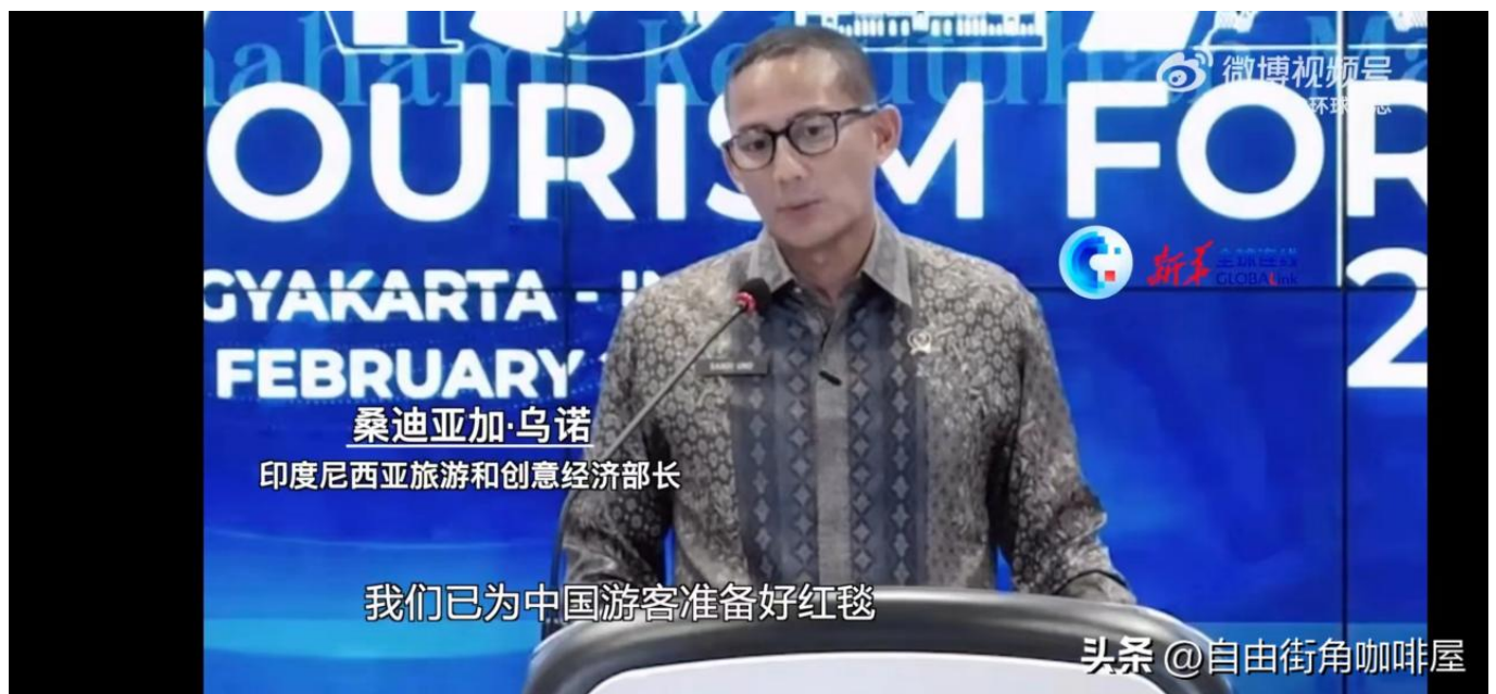
印尼旅游和创意经济部长发言

而此前因韩国政府强制中国游客挂黄牌，中国飞韩国的航班必须在仁川机场降落等一系列歧视性政策引发的不满，更是令韩国旅游业及经济的恢复进程按下暂停键。