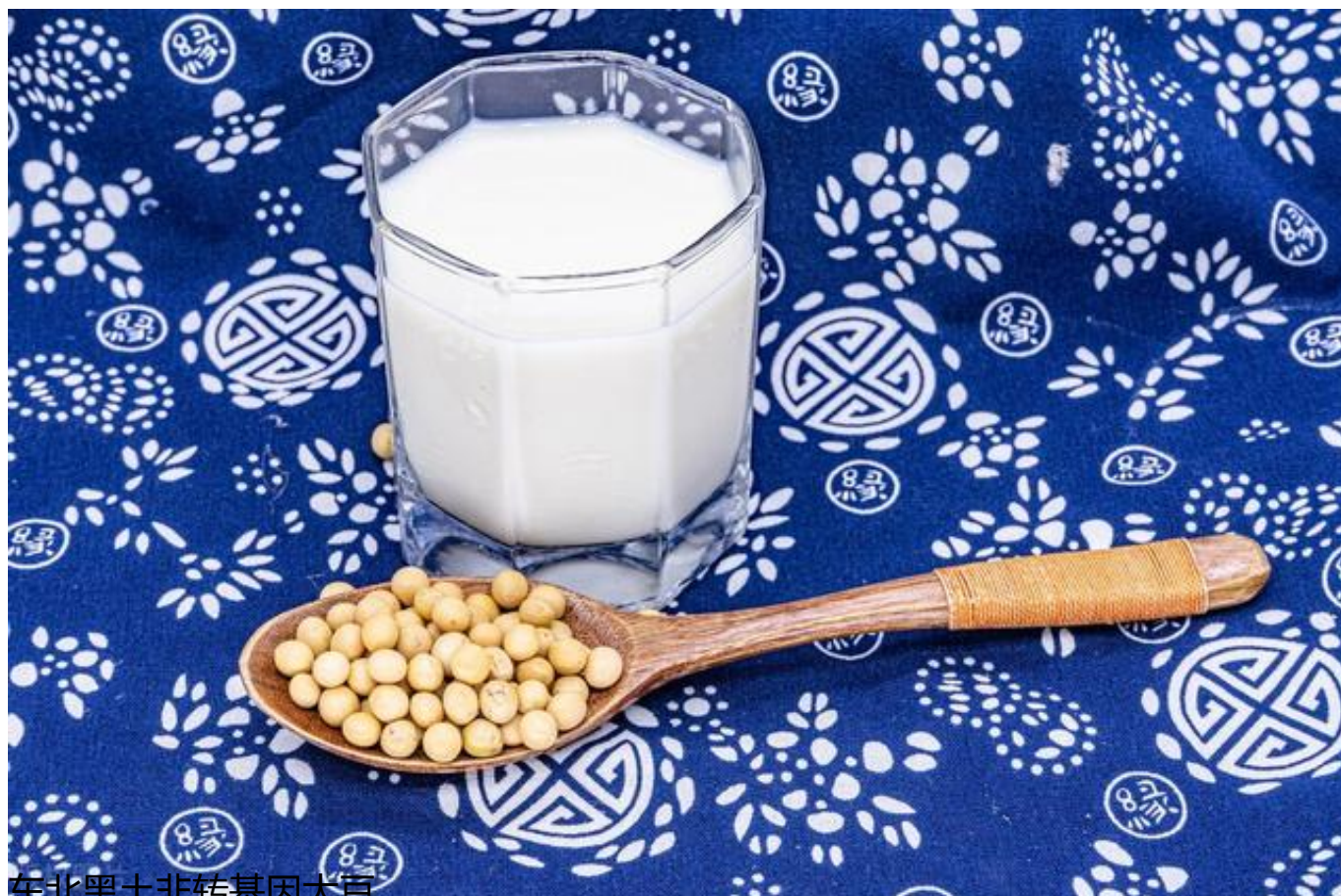
东北黑土非转基因大豆

我们经常能在撸串的时候吃的毛豆，一般来说是国内的大豆。因为这种国内的大豆基本都是非转基因的，其中以东北大豆为代表。