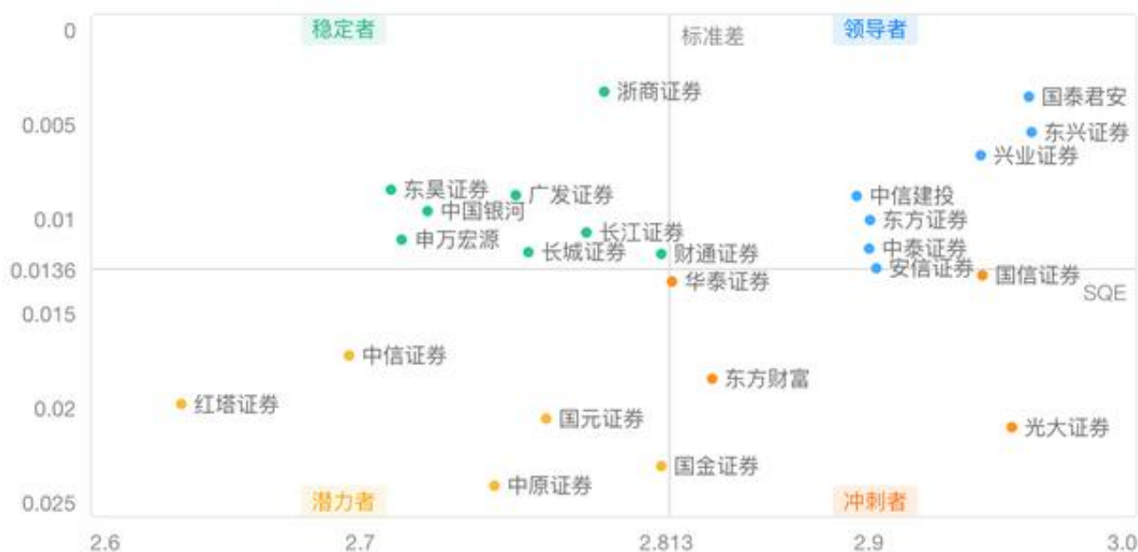
券商App行情SQE能力象限