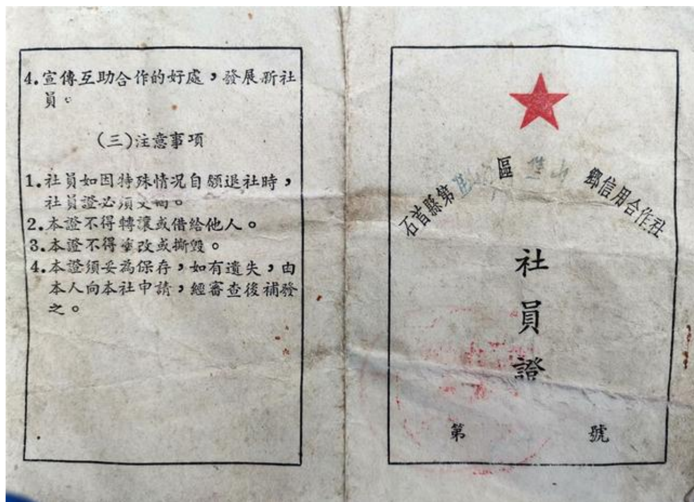
1956年的石首县焦山乡农村信用社社员证