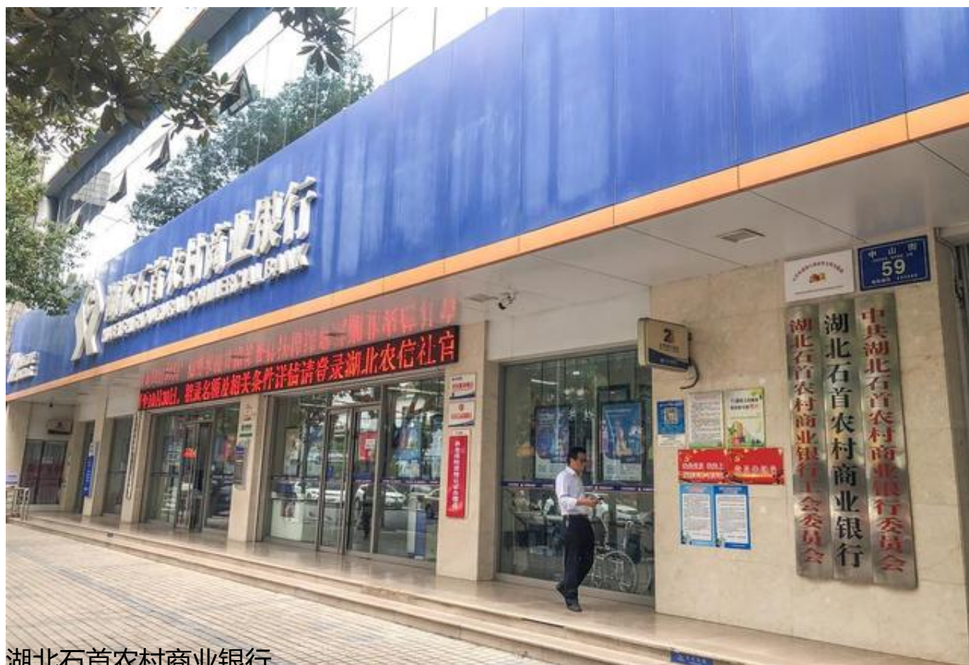
湖北石首农村商业银行