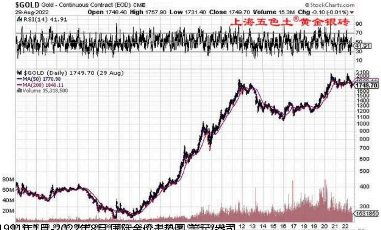
1991年1月-2022年8月国际金价走势图 美元/盎司

过去20年间金价走势（见上图），自2002年起，金价掉头向上，持续直线上涨到2012年，持续上涨10年多，2002年约355美元/盎司，2022年8月，黄金价格约1722美元/盎司，翻了4.9倍，年递增率8.2%。