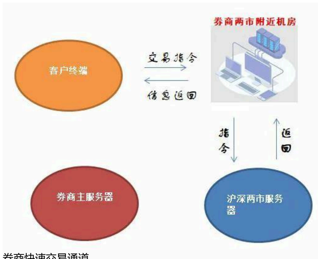
券商快速交易通道

图示中，由于券商机房与交易所机房物理距离较近，股票用户的交易指令能够快速送达交易所，所以指令成交速度快一些，这种即被称为“券商快速交易通道”。优点是快一些；缺点仍然多用户共用交易通道，因此是非独立交易单元，若指令量大，仍然会有信号卡顿的现象。但是券商为了维护服务的体验感，往往会限制快速交易通道的使用户数，所以快速交易通道的使用体验往往不会太差，最起码的逼格是有的。