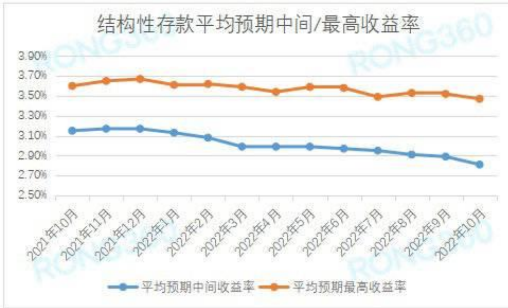
人民币结构性存款平均预期中间收益率、平均预期最高收益率走势

在发行结构性存款的4家国有银行中，10月份中国银行、交通银行平均预期最高收益率在3%以上，不同产品的预期最高收益率差别较大。