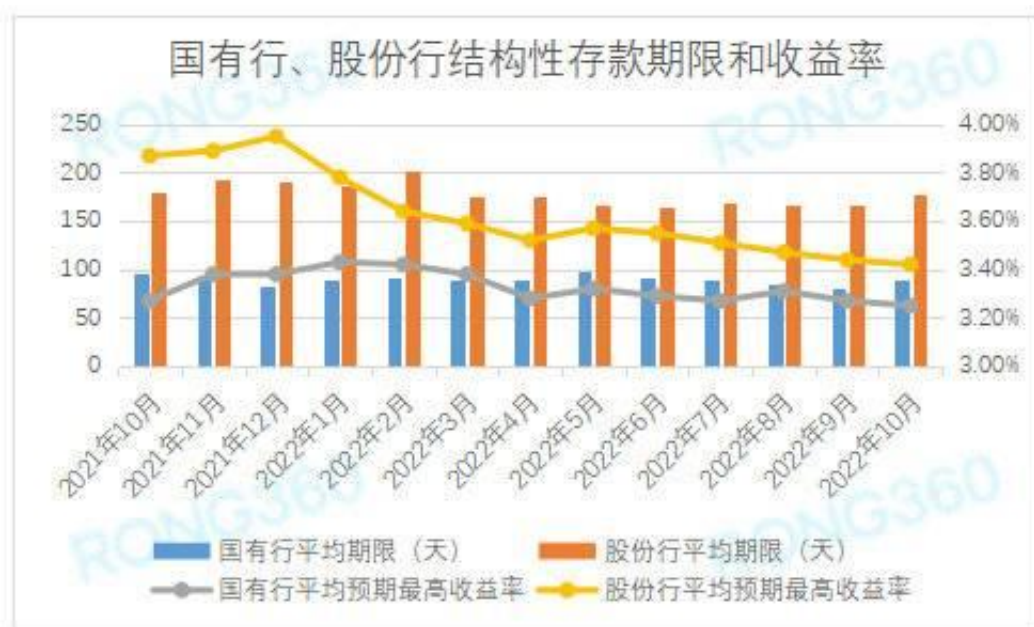
国有银行、股份制银行人民币结构性存款平均期限和平均预期最高收益率