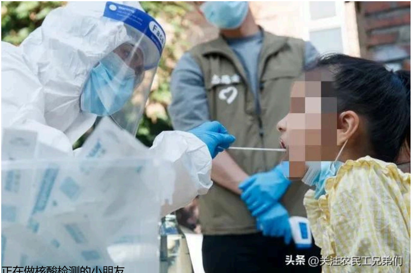
正在做核酸检测的小朋友

而且我这个健康码的更新时间，是在昨天夜里的将近11点的时候才更新的。我这个健康码的更新时间，进入劳务市场去找活干应该是没什么问题了吧？哪知道，就在我信心满满，认为自己的健康码没有问题的时候。那位工作人员却给我来了一句，你这个核酸检测是昨天才做的。而我们需要的是你要有今天早上刚做的核酸检测，才能允许你进入劳务市场找活干。