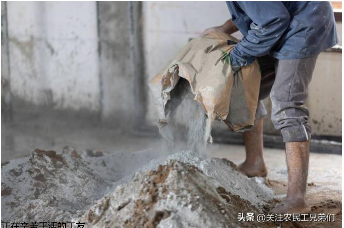
正在辛苦干活的工友

既然有了这个决定，我就连忙向离劳务市场，最近的一个核酸检测点赶去。哪知道等我赶到这个核酸检测点后发现，今天早上来这个核酸检测点，排队做核酸检测的工友是真多啊？面对这一眼望不头的核酸检测队伍，我的心中真是充满了一阵阵的无奈啊！