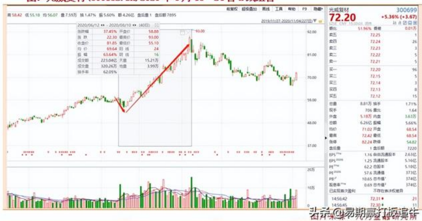
图：光威复材(600132.SH)2020年6月15—24日K线组合

以上，就是我们本期拆解的K线组合形态。我们认为，K线形态为市场多空力量对比真实写照，多空双方旗鼓相当的时候，K线多表现为十字星或小阴小阳线；一方强于另一方则表现为中阴或中阳线；一方大获全胜则表现为大阴或大阳线；出现长上影线为多转空，出现长下引线为空转多。