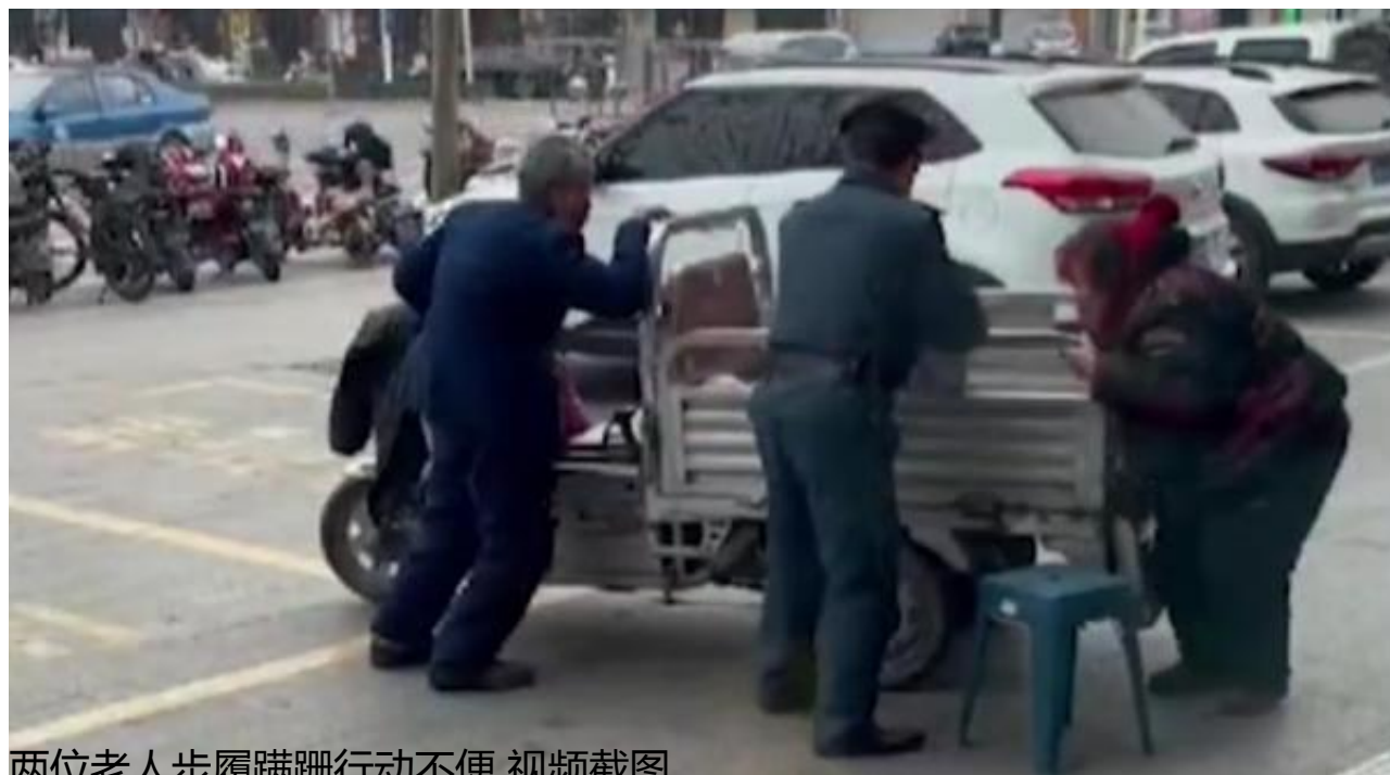
两位老人步履蹒跚行动不便 视频截图

21日，河北邯郸网友“歌奥高”称，自己在银行值班时，碰上一对老两口来查询已故儿子的存款。老人称，儿子在铁厂工作时不幸离世，听人说儿子在银行有存款，但不清楚具体哪家，只能一家家银行挨着查询。查询过程中，老人提及儿子因家贫一直未能娶妻，因公去世后工厂方面赔付了几十万，一句“有钱能娶媳妇了，这人却死了”让众多网友破防。